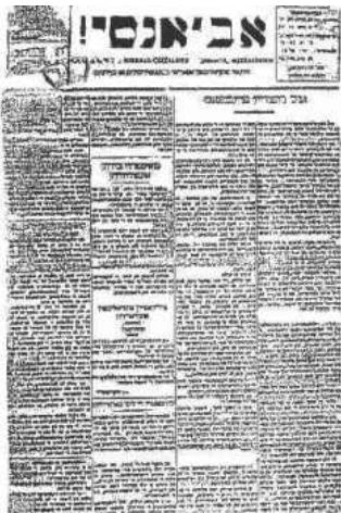
Εβραϊόφωνη (λαντίνο) σοσιαλιστική εφημερίδα της Θεσσαλονίκης “Avanti”, που σημαίνει “Εμπρός”. Όργανο του Σοσιαλιστικού Εργατικού Κόμματος Ελλάδας (ΣΕΚΕ) στη Θεσσαλονίκη, μετέπειτα του ΚΚΕ.

Ήταν τόσο προφανές για τους Εβραίους το από τι κινδυνεύουν, που τα επόμενα χρόνια χιλιάδες εξ αυτών οργανώθηκαν (ανάλογα με την πολιτική τους άποψη και την ταξική τους θέση) στις δύο πολιτικές τάσεις που οργάνωναν συλλογικά, με πολύ διαφορετικούς τρόπους και στόχους βέβαια, την άμυνα απέναντι στα σχέδια του ελληνικού κράτους και κεφαλαίου: τους σιωνιστές από την μία, και τους σοσιαλιστές της Φεντερασιόν από την άλλη. Δεν έχουμε αντίστοιχα ιστορικά στοιχεία για το αν αύξησαν τα μέτρα πυροπροστασίας στα σπίτια και τα μαγαζιά τους. Εικάζουμε πως μάλλον όχι.