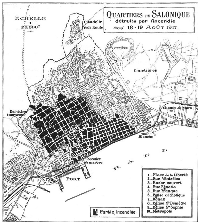
Σχέδιο που απεικονίζει (με μαύρο χρώμα) την Πυρκαϊσθη Ζώνη

Το μεσημέρι της 5ης Αυγούστου του 1917 ξέσπασε μια πυρκαγιά στην γειτονιά της πλατείας Μουσχουντή. Σύμφωνα με την (αμφισβητούμενη) επίσημη εκδοχή του ελληνικού κράτους, σε ένα σπίτι προσφύγων, στην οδό Ολυμπιάδος 3, ενώ μια προσφύγισσα τηγάνιζε μελιτζάνες, το λάδι πήρε φωτιά η οποία αμέσως εξαπλώθηκε στο σπίτι. Με την συνδρομή του Βαρδάρη, η φωτιά φεύγει πέρα από κάθε έλεγχο. Εν ολίγοις, διαρκεί περίπου 32 ώρες και καίει το 1/3 της έκτασης της πόλης, συμπεριλαμβανομένου του εμπορικού και ιστορικού της κέντρου.