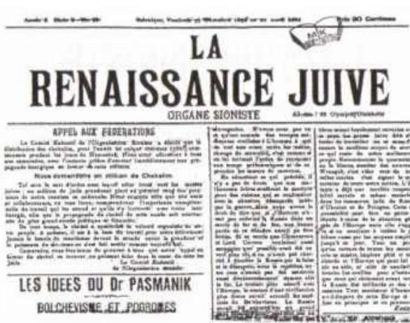
Γαλλόφωνη σιωνιστική εφημερίδα της Θεσσαλονίκης “La renaissance juive”, που σημαίνει “Εβραϊκή Αναγέννηση”.